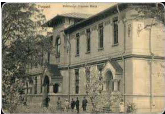
Orfelinatul Principesa Maria