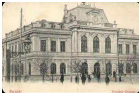
Primaria orasului Focsani Anul 1900