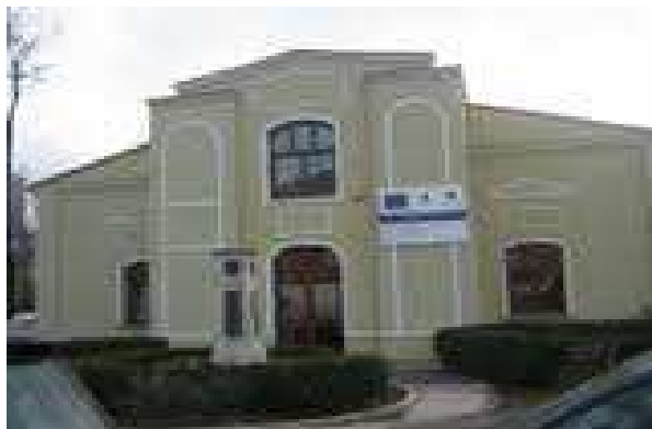
Cladirea fostului parchet