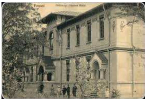
Orfelinatul Principesa Maria