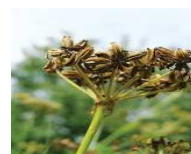
Semintele de leustean