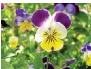
Trei-frati-patati ( Viola tricolor )