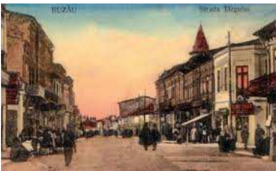
Centrul Buzăului de odinioară