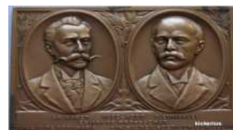
Spiru Haret si David Emmanuel

U.N.E.S.C.O. a recomandat, la fel ca și în ultimii ani, aniversarea unor personalități eminente din domeniul științei. Printre aceste, se afla, alături de savanții Nicolae Coculescu, Emanoil Teodorescu și Nicolae Teclu, figura proeminentă a școlii matematice românești care a fost David Emmanuel. La 14 februarie 2012 s-au împlinit 158 ani de la nașterea lui David Emmanuel și 71 de ani de la moarte. Membru al Academiei R.S.R., el a fost fondatorul școlii române de teoria funcțiilor, cunoscută azi în toată lumea. Ca mai toți savanții din vremea lui, David Emmanuel a avut de luptat cu sărăcia, fiind nevoit încă din liceu să dea lecții copiilor mai înstăriți, tatăl său, un meseriaș tamplar, neavând mijloace să-l întretină.