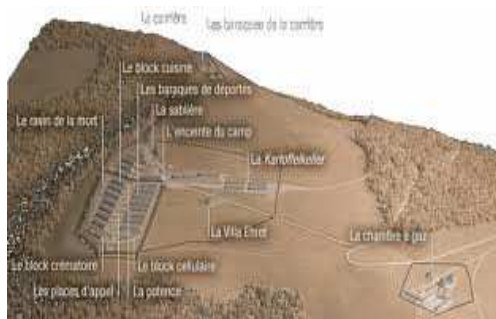
plan du struthof

„Astăzi – notează Maşa – au fost tunse toate femeile. Noaptea trecută am dormit ascunsă sub un cadavru”. Jurnal fusese inițial scris în limba idiș, în ghetoul din Vilnius și în lagărele de concentrare naziste. Însemnările ei din anii teribili au fost tipărite, la început la Moscova, apoi și în alte părți, constituind o mărturie zguduitoare a barbariei naziste. Curînd jurnalul a fost publicat la Moscova ca o carte separată sub titlul „Trebuie să vă spun”. Apariția acestei cărți, memoriile doar de un supraviețuitor al Holocaustului publicate vreodată în URSS-a devenit posibilă ca urmare a eforturilor multor oameni, inclusiv scriitorul sovietic proeminent și figură publică Erenburg Ilya (1891-1967). Jurnalul Mașei Rolnik a apărut la Paris, în versiunea franceză. Cu acest prilej autoarea a fost invitată în capitala Franței, vizita ei fiind relatată de presă, radio și televiziune. Din 1965 a apărut în 18 de limbi, iar în 1967 prima traducere germană a fost făcută în Germania de Est. Ea este căsătorită cu un rus care locuiește și lucrează în