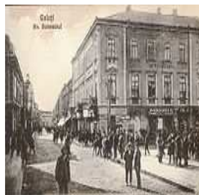
-Articol primit de la Weiss M.-