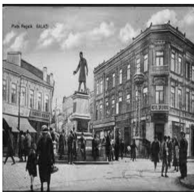
Piata regala – Galati

Asa cum reiese si din enumerarea de mai sus a sinagogilor, evreii s-au organizat si in organizatii profesionale ( aceasta ca si replica in refuzul breslelor locale de a primi meseriasii evrei ). Astfel in anul 1826 se infiinteaza Breasla Croitorilor evrei, in anul 1874 – Societatea meseriasilor evrei in anul 1893, - Societatea functionarilor din port in anul 1895, - Asociatia zugravilor si vopsitorilor evrei precum si infiintarea Societatii macelarilor evrei, etc. O preocupare constanta a fost crearea formelor de ajutorare a celor in nevoi. Astfel in anul 1874, se infiinteaza Societatea de ajutor si binefacere a meseriasilor israeliti din orasul Galati, care acorda ajutoare celor bolnavi precum si familiilor celor decedati. Societatea acorda donatii si catre Asociatia studentilor evrei din Bucuresti si Cernauti, precum si Orfelinatului de copii, Azilul de batrani si Cantinei populare evreiesti din localitate.