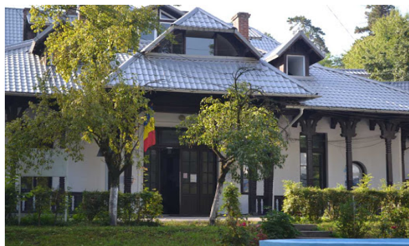
Spitalul - Constantin Anastasatu din Mihaesti