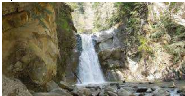
Cascada Cașoca – cădere de apă