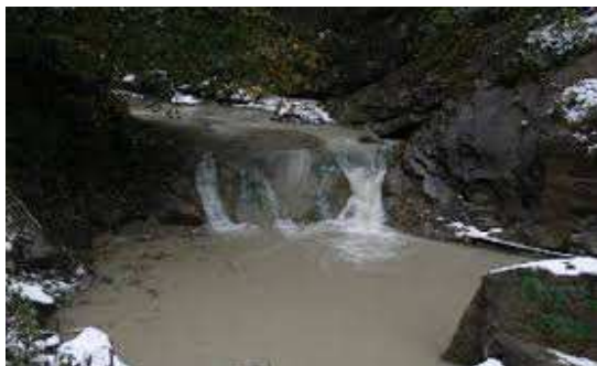
Cascada Pruncea .