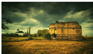
Ruinele Bisericii Albe de la Târgșor.