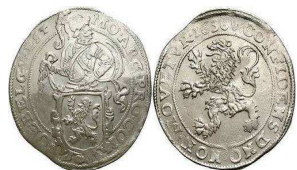
Taleri de argint

Discuțiile au fost realuate în timpul domniei lui Carol I. Denumirea de leu s-a ales pe fondul popularității talerului olandez care avea pe revers un leu ridicat pe două labe. Talerul avea o largă circulație a teritoriul Principatelor datorită relațiilor comerciale dintre Imperiul Otoman și Vestul Europei. La jumătatea secolului al XVII-lea, notorietatea thalerului era atât de mare încât în spațiul balcanic acesta este confundat cu noțiunea de monedă. Cu toate că a ieșit din circulație în jurul anului 1750, talerul de argint intrase atât de bine în conștiința publică, încât românii au continuat să calculeze prețurile în această monedă. De aceea s-a decis ca leul să devină denumirea oficială a noii monede naționale românești.