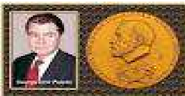
George Emil Palade și medalia Premiului Nobel