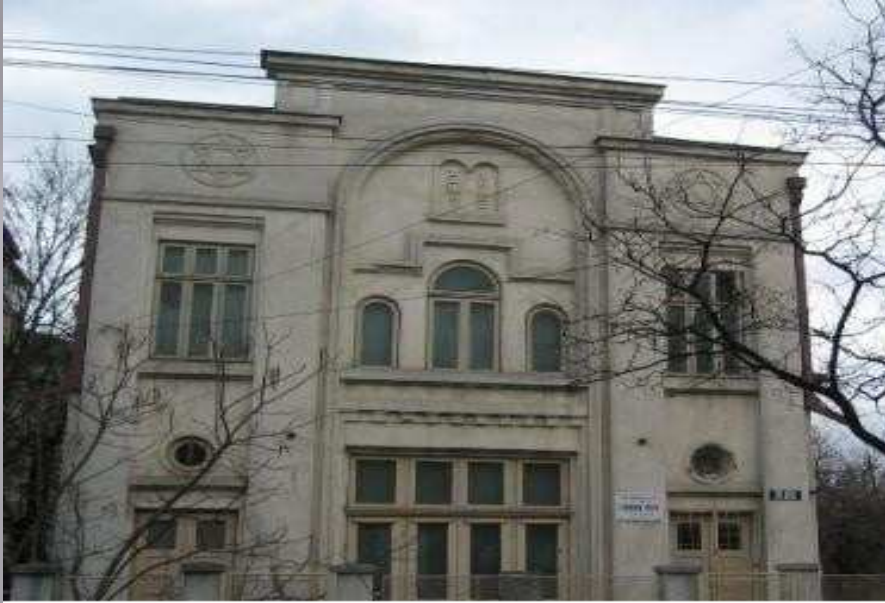
Revista Menora Focsani