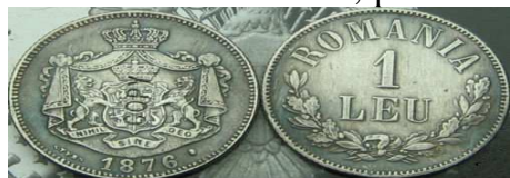
Leu românesc din 1876

Pe teritoriul României, primele monede au apărut în cetățile grecești de la malul Mării Negre. Au circulat atunci drahme de bronz ori argint, stateri de aur și tetradrahme de argint. În urmă cu 146 de ani, leul a devenit moneda națională a Principatelor Române, pe al căror teritoriu circulau până la acea dată în jur de 80 de monede străine, precum napoleonul, galbenul austriac, ducatul olandez, piastrul, rubla sau francul.