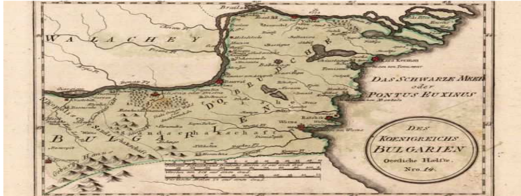
hartă veche a Dobrogei, din anul 1789.

Pe drumul spre Babadag, pe malul pârâului Casimcea exista o așezare înfloritoare, Ester, cu 1.500 de case, cu vii și grădini, cu biserici și prăvălii.