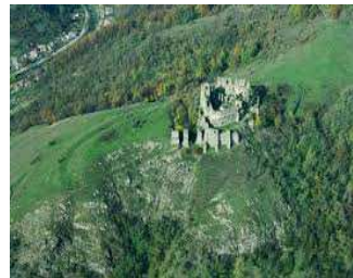
Ruinele Cetății Șoimoș pe dealul

Cioaca Tăutului de lângă Lipova, foto: aprilie 2012.