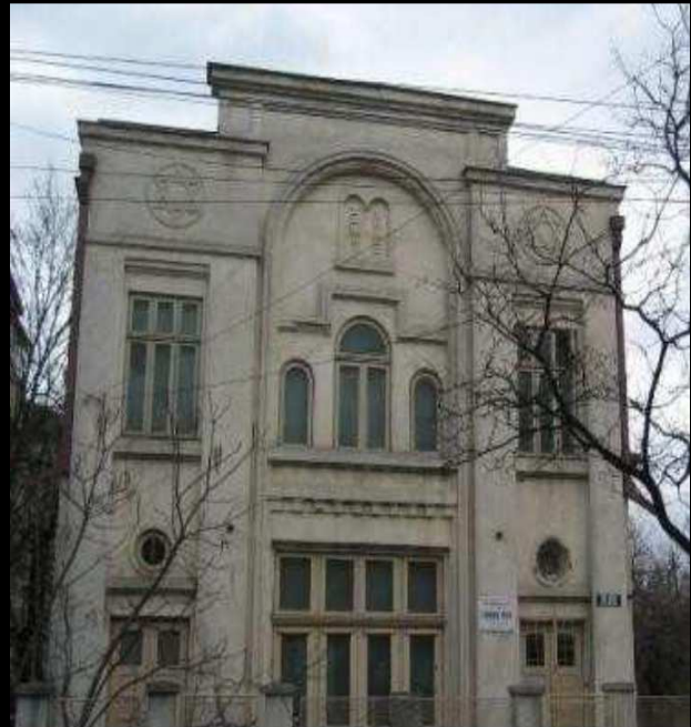
Revista Menora Focsani