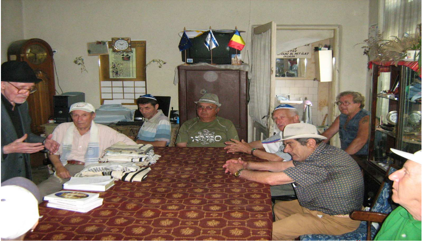
„MEMBRII CENACLULUI LITERAR DE LA SINAGOGĂ”